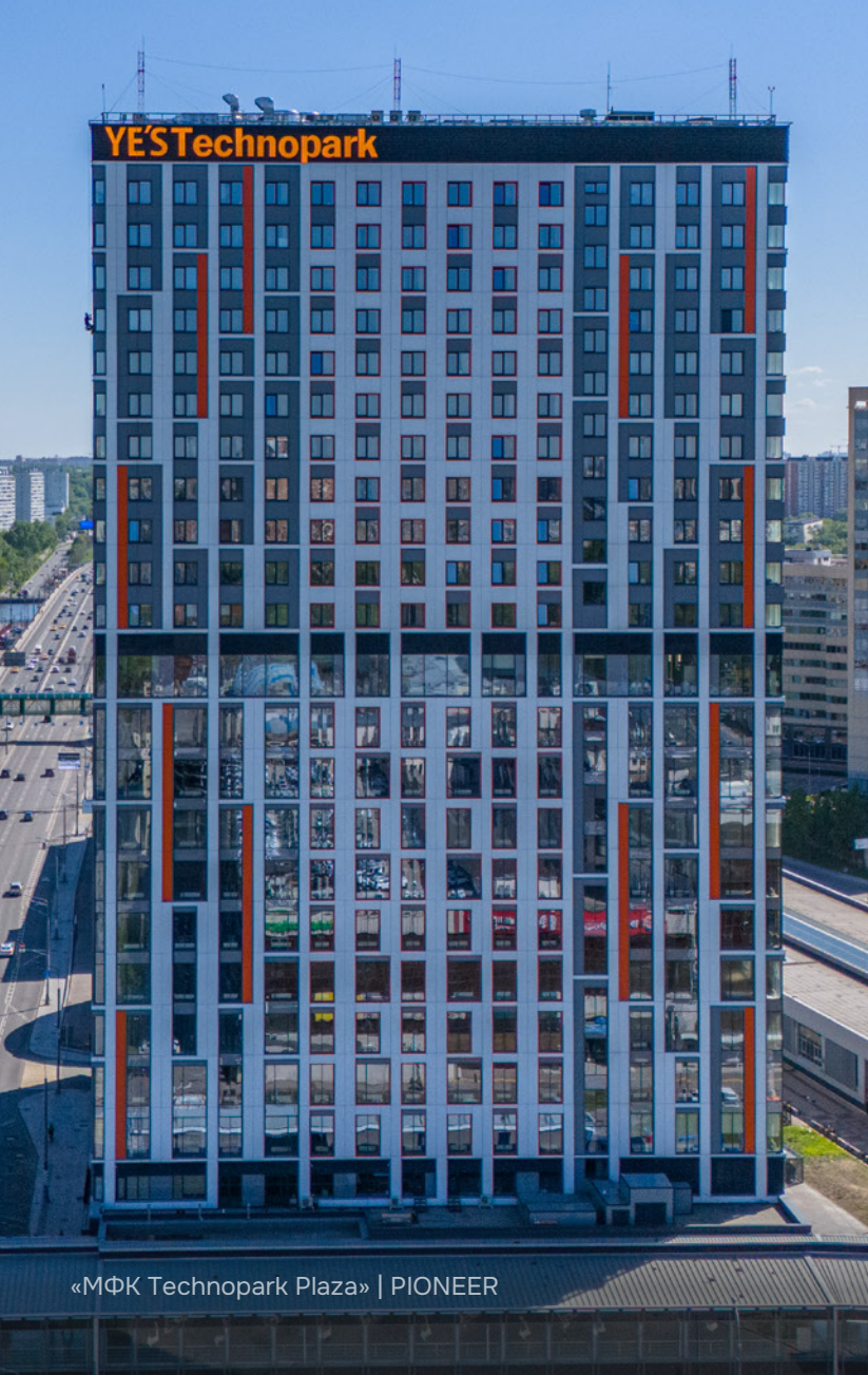
«МФК Technopark Plaza» | PIONEER