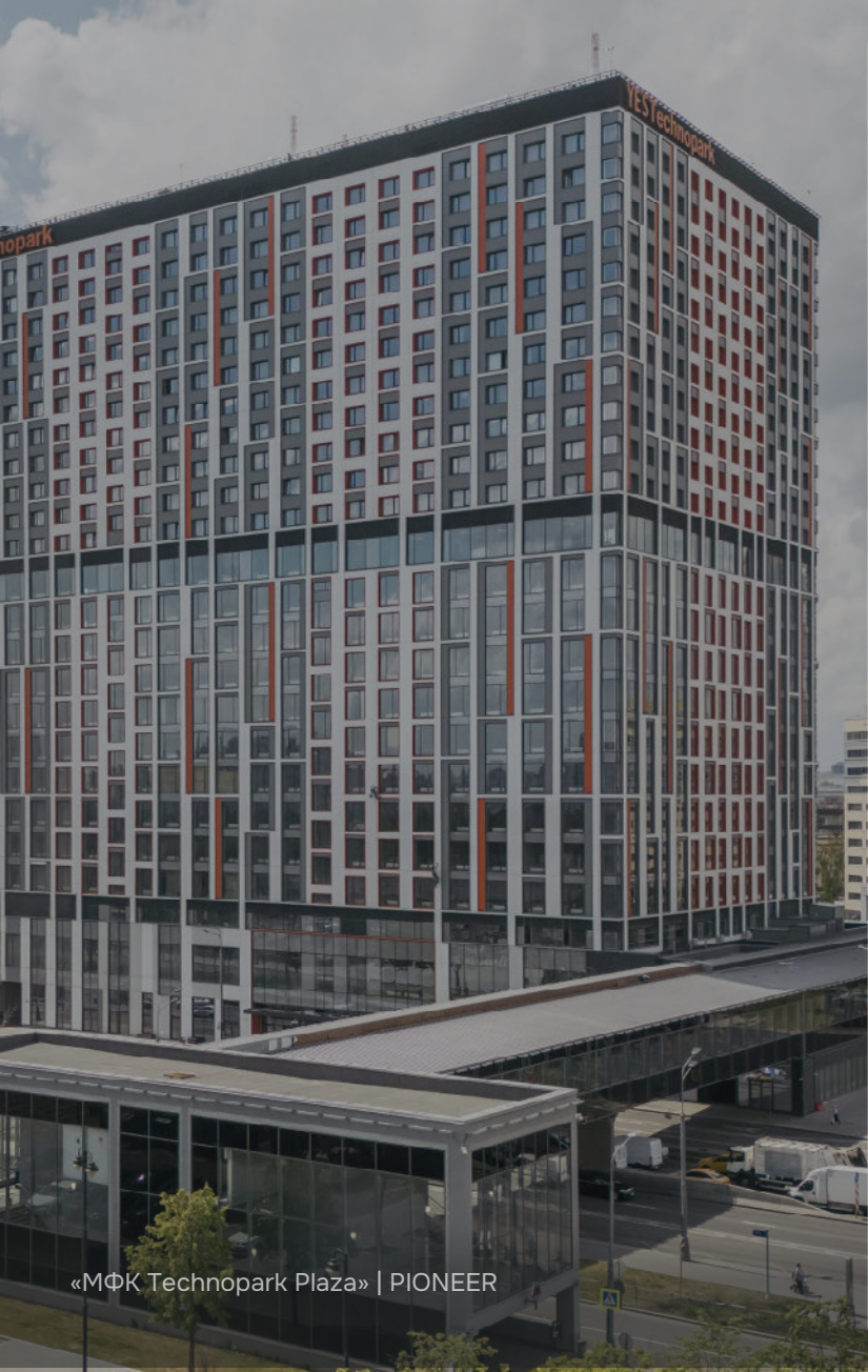
«МФК Technopark Plaza» | PIONEER